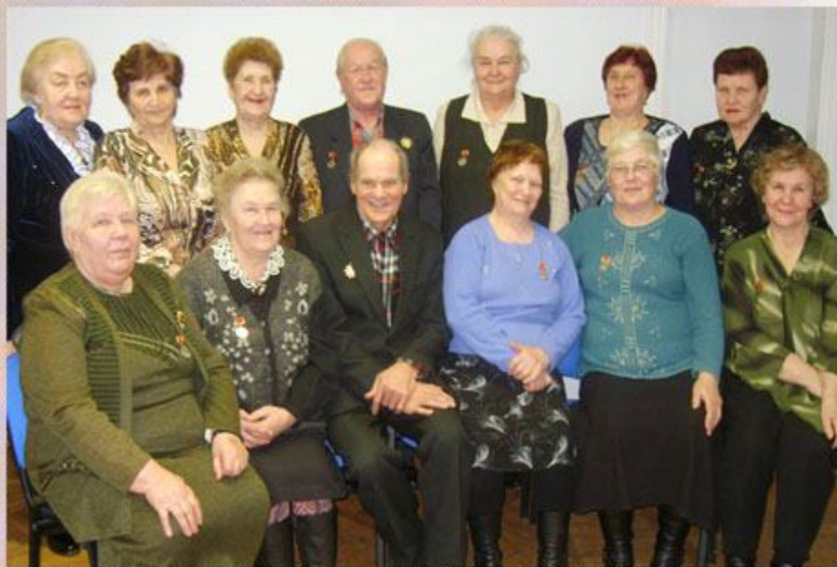
Актив общества БМУФ г. Луги