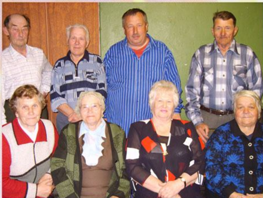
Актив и узники дер. Перечицы