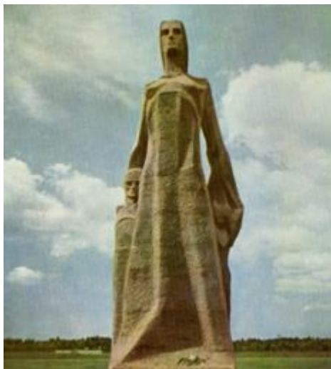
Скульптура посвящена матерям – узницам Саласпилса

Чтобы сохранить в веках память о жертвах фашистского террора, на месте бывшего концентрационного лагеря сооружен Саласпилский мемориальный ансамбль. Авторами его являются архитекторы Г. Асарис, О. Закаменный, О. Остенберг и И. Страутманис, а также скульпторы А. Буковский, Я. Заринь и О. Скарайнис.