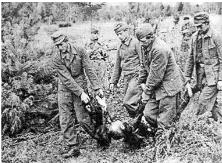
Немецкие военнопленные переносят тела узников концлагеря «Клоога» (Эстония)