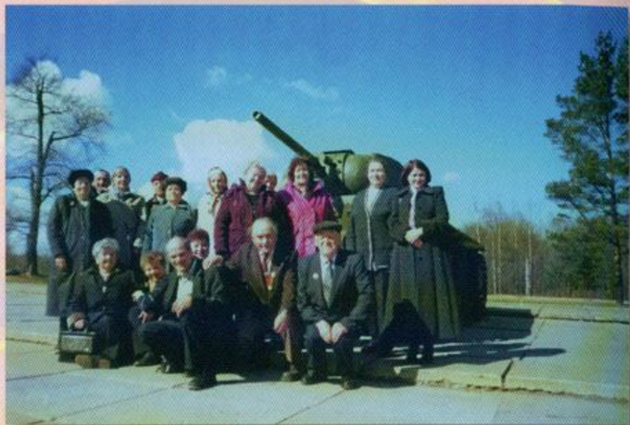
Узники Лужского района на Невском пятачке