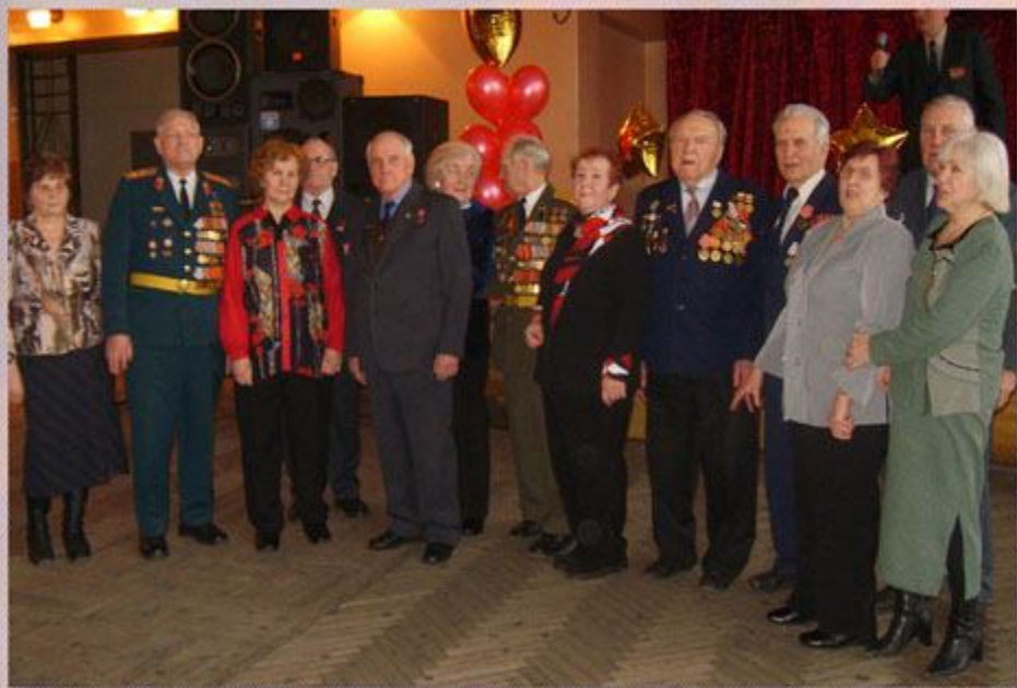
На празднике, посвященном Дню освобождения узников 11 апреля