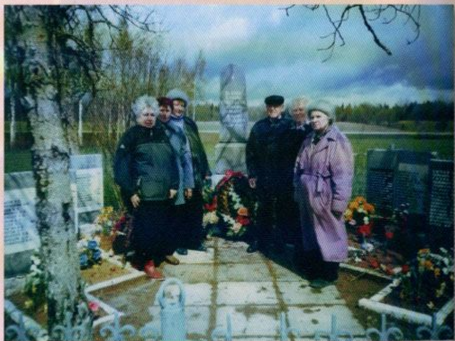
дер. Перечицы, посещение мемориала